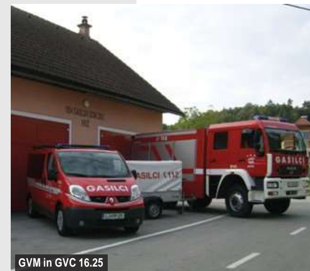
GVM in GVC 16.25

V letu 2012 je bil na občnem zboru sprejet nov statut društva, ki ga je potrdila tudi Upravna enota Kamnik. Uvedli smo nov sistem ASK, namenjen medsebojnemu obveščanju in sklicevanju sestankov. Zamenjali smo vhodna vrata v stanovanjski del gasilskega doma in na kulturnem domu zamenjali okna. Za potrebe gasilske veselice sta bila izdelana dva jurčka.