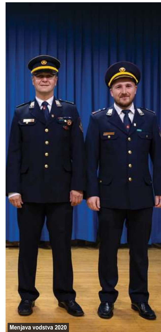
Menjava vodstva 2020

Leto smo zaključili z raznosom koledarjev krajanom Križa in dela Podgorja, vendar tokrat malo drugače. Brez stiska rok in tople besede. S koledarjem na kljuko in priloženo položnico z dobrimi željami. A ljudje nas tudi tokrat niso razočarali in zato smo jim hvaležni.