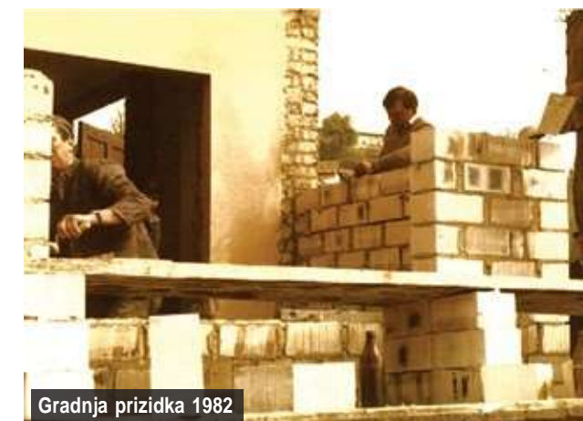
Gradnja prizidka 1982