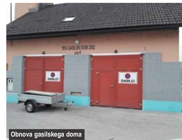
Obnova gasilskega doma