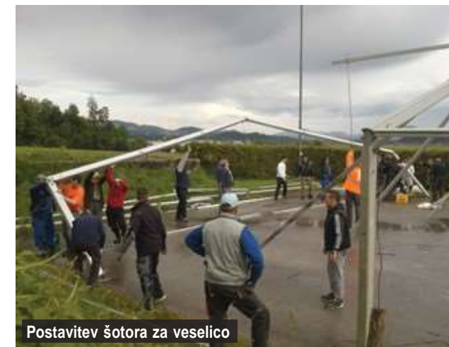
Postavitev šotora za veselico