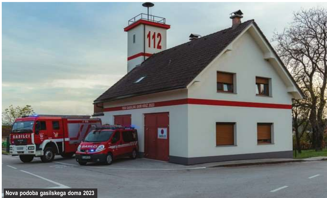
Nova podoba gasilskega doma 2023