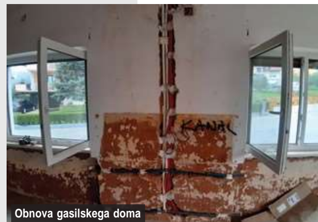
Obnova gasilskega doma