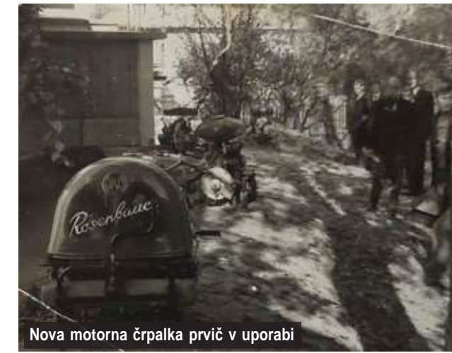
Nova motorna črpalka prvič v uporabi

Leta 1972 je bil v gasilski dom napeljan telefon.