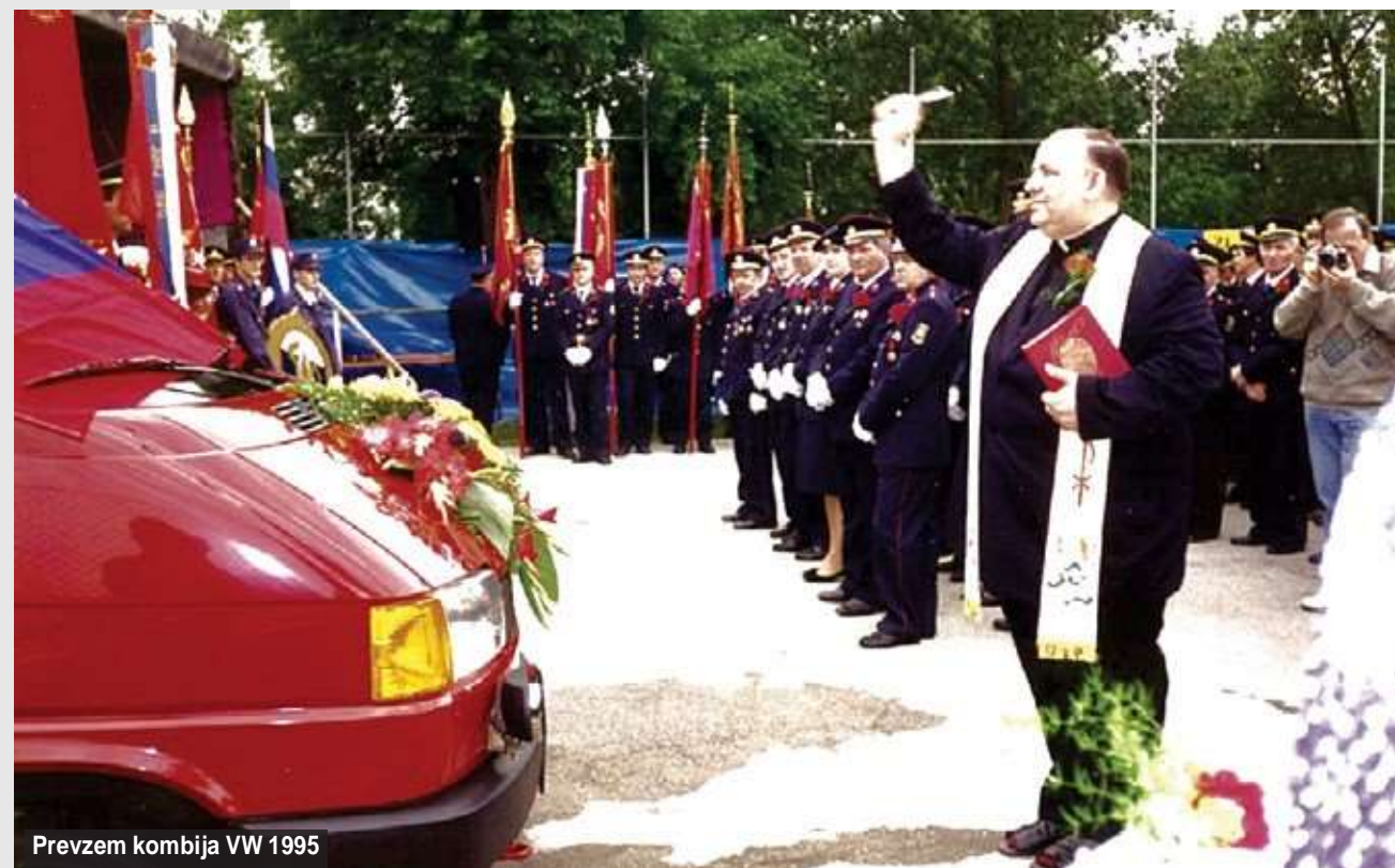
Prevzem kombija VW 1995

12. junija 1994 je bilo praznovanje 40. obletnice društva. Pokrovitelj slovesnosti je bila Kravevna skupnost Križ. Kupili smo kombi VW 1.9 TDI. Prodali pa smo kombi IMV 1600 Super B. GD Križ je postal lastnik stavbe in zemljišča Doma krajanov - Breznikovega doma s sklepom KS Križ. Do tedaj sta bila lastnika oba. Sklep sodišča je bil izdan 30. decembra 1994.