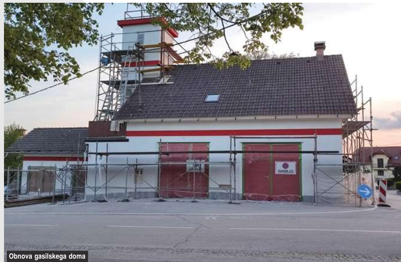
Obnova gasilskega doma