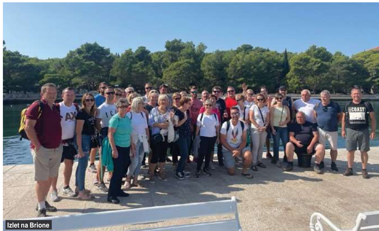
Izlet na Brione