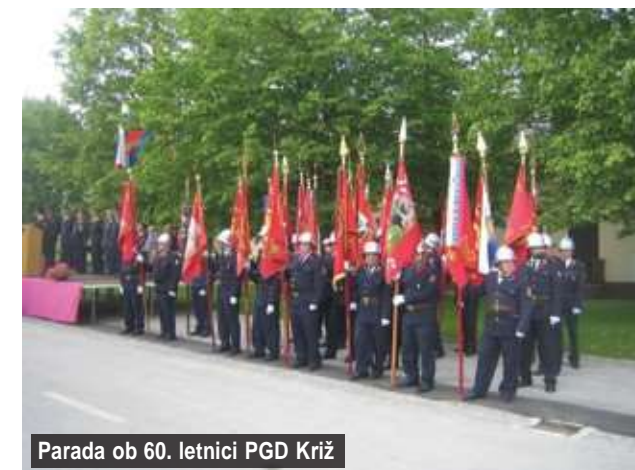
Parada ob 60. letnici PGD Križ