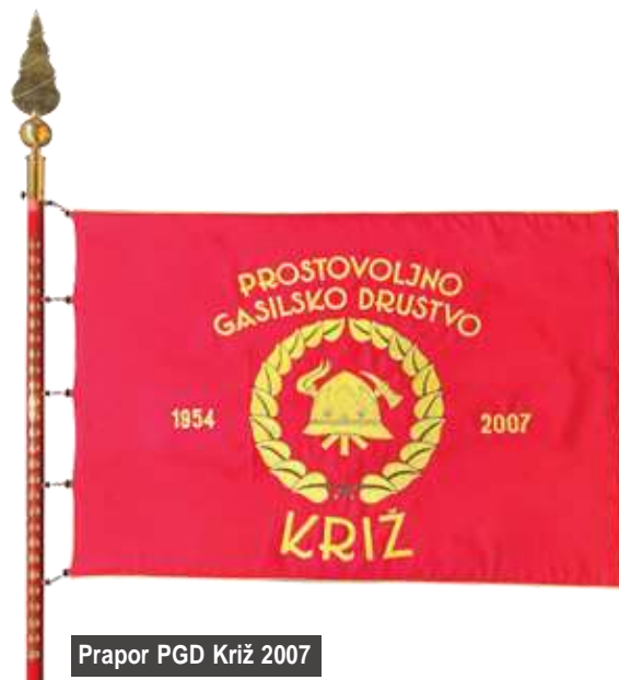
Prapor PGD Križ 2007

V letu 2009 je društvo praznovalo 55. obletnico aktivnega delovanja društva in 50. obletnico postavitve temeljnega kamna za gasilski dom. Obletnico smo želeli počastiti s prevzemom novega gasilskega vozila za prevoz moštva GVM. Žal pa nam je prepozno izdano soglasje prekrižalo načrte in smo morali slovesnost preložiti v naslednje leto.