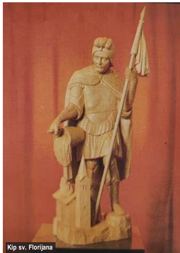
Kip sv. Florijana

13. junija 1993 smo organizirali blagoslovitev kipa sv. Florijana. Blagoslovil ga je komendski župnik in dekan Nikolaj Pavlič. Ob tej svečanosti je blagoslovil tudi gasilski dom in oba avtomobila.