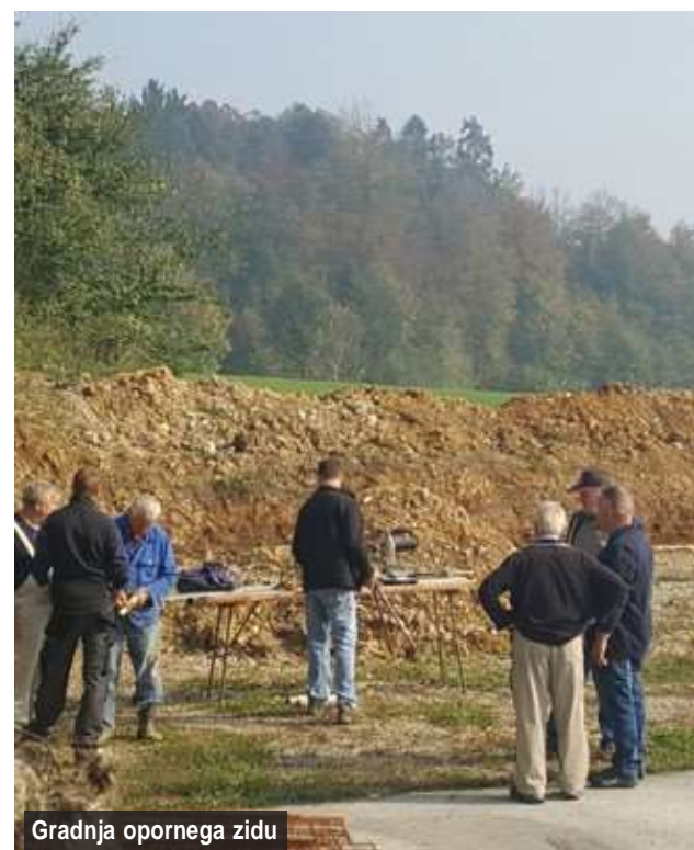
Gradnja opornega zidu