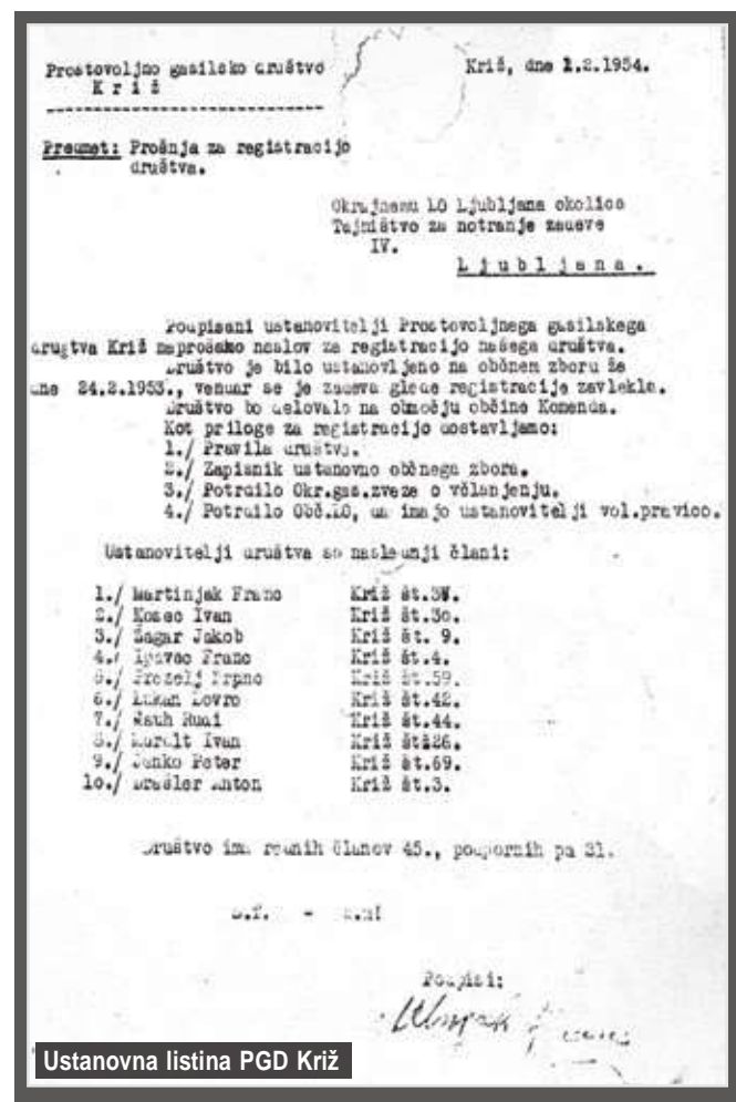
Ustanovna listina PGD Križ

24. februarja 1953 je pripravljalni odbor PGD Križ podpisal pogodbo s PGD Komenda za posojilo ročne brizgalne s pripadajočo opremo. Ročna brizgalna je bila spravljena v vaški sušilnici, ki je stala nasproti današnjega gasilskega doma. V njej so vaščani Križa sušili sadje. Imeli so tudi skupne kmetijske stroje, čistilnico za žito in dve sejalnici za sejanje žita.