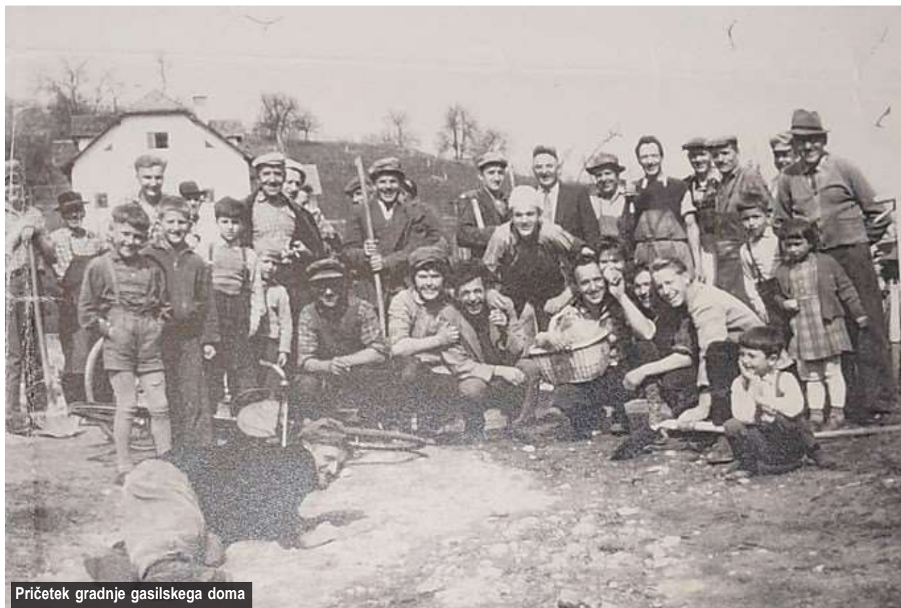
Pričetek gradnje gasilskega doma