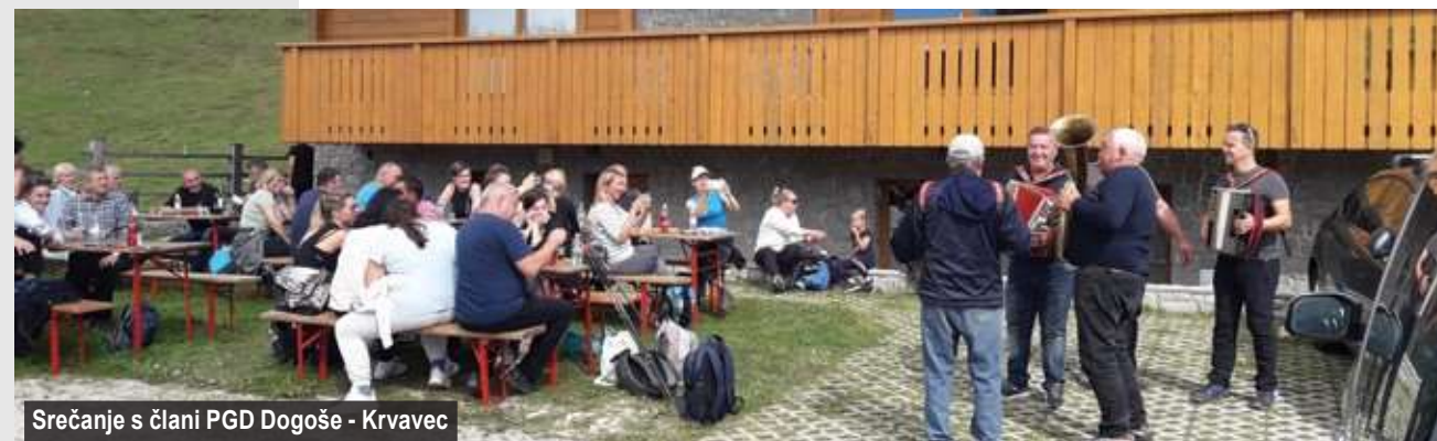
Srečanje s člani PGD Dogoše - Krvavec