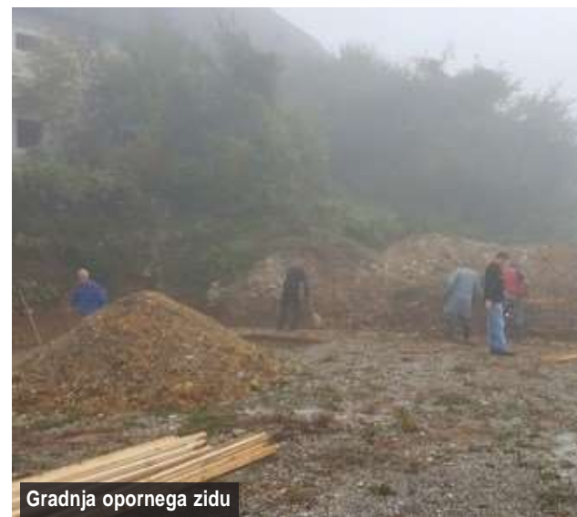
Gradnja opornega zidu

Za pozitivno razpoloženje na veselici je poskrbel ansambel Veseli svatje.