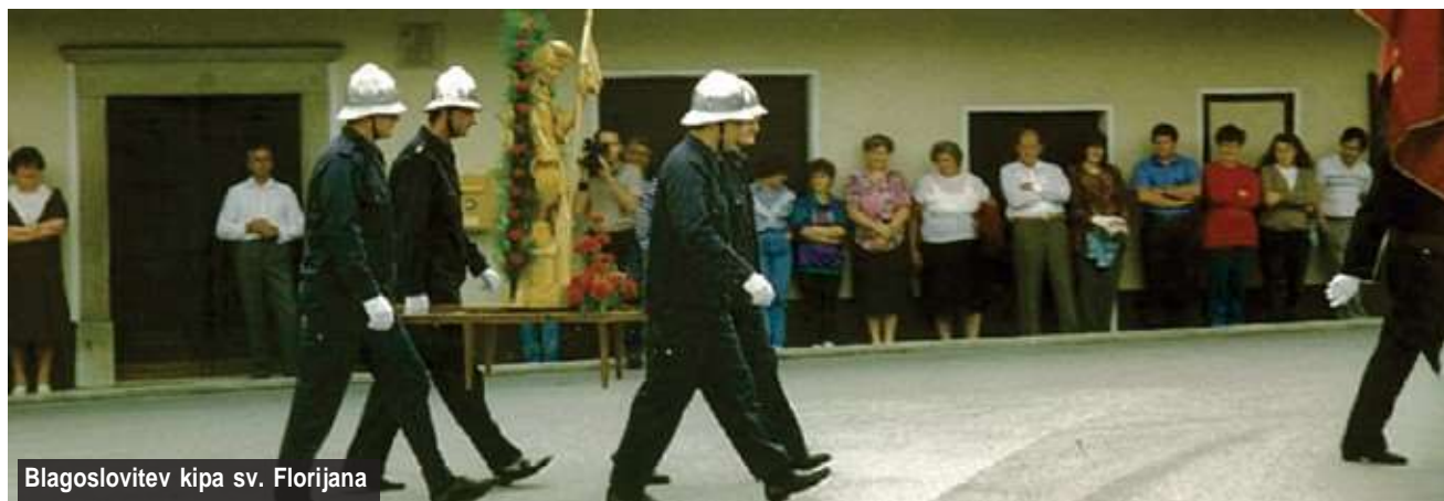
Blagoslovitev kipa sv. Florijana