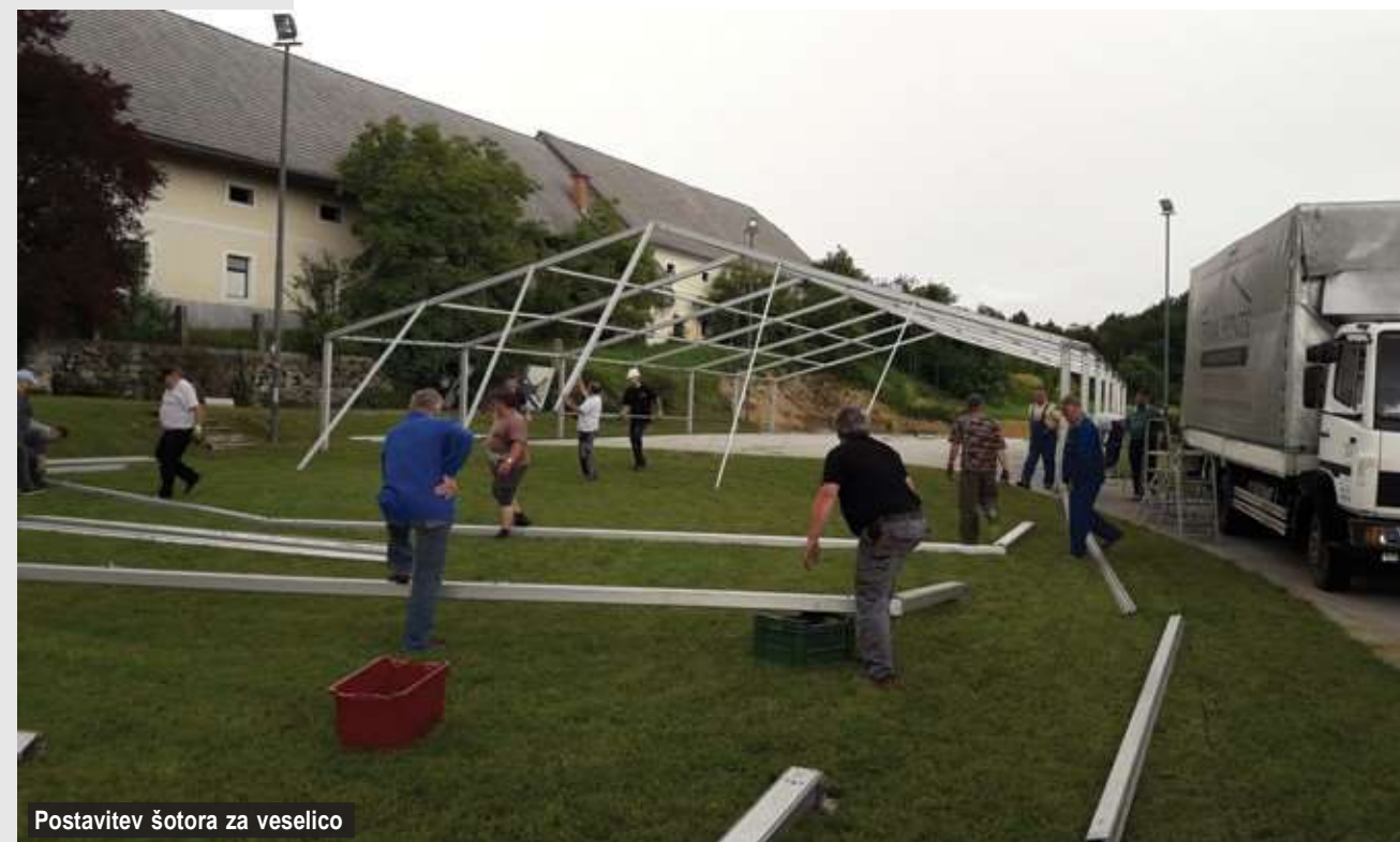
Postavitev šotora za veselico