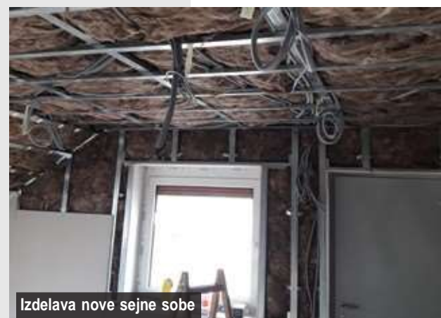
Izdelava nove sejne sobe