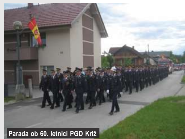
Parada ob 60. letnici PGD Križ

Pomembna novost v letu 2014 je bila izdelava novega grba PGD Križ, na katerega smo člani še posebej ponosni. Zaživela je nova spletna stran društva, na kateri najdemo nekaj podrobnosti o našem delovanju.