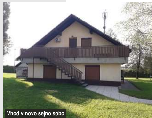
Vhod v novo sejno sobo