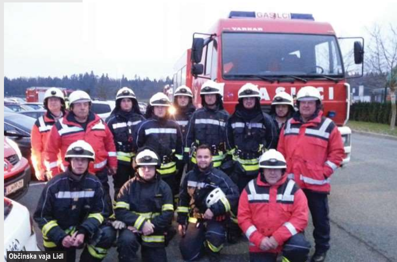
Občinska vaja Lidl