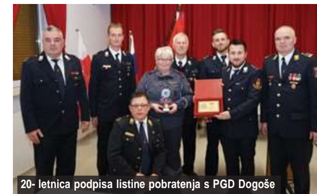
20-letnica podpisa listine pobratenja s PGD Dogoše

Novemu vodstvu ter upravnemu odboru želimo hrabro in zag-nano vodenje, kar je pogoj za nadaljni uspeh in razvoj društva.