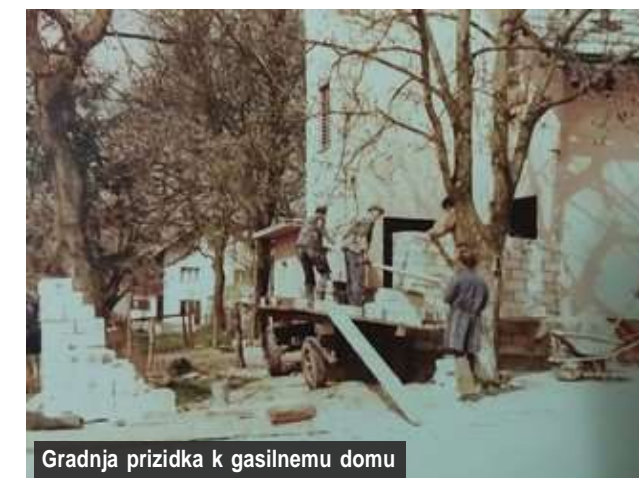
Gradnja prizidka k gasilnemu domu