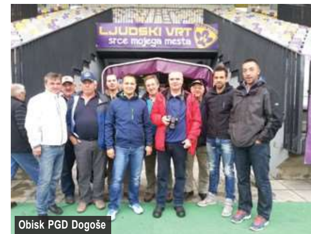
Obisk PGD Dogoše