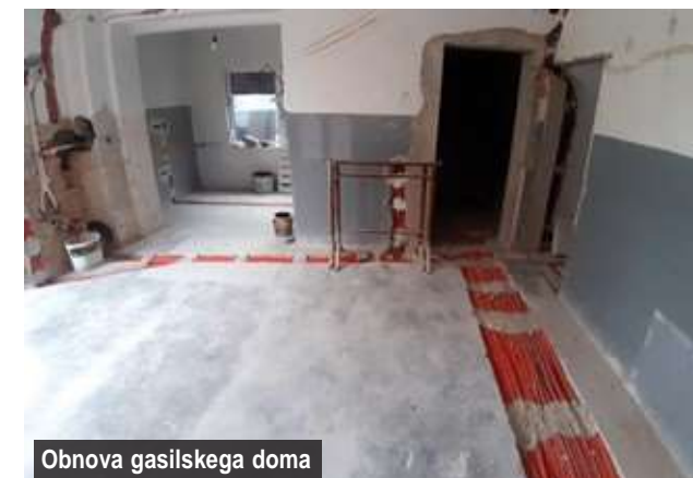
Obnova gasilskega doma