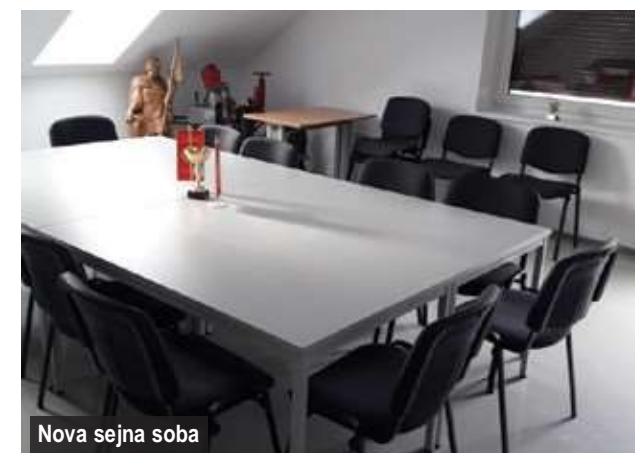
Nova sejna soba